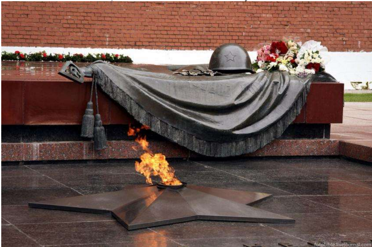
(Могила неизвестного солдата. Г. Москва)

Много погибло в той войне, многие имена неизвестны. Вы узнали этот памятник?